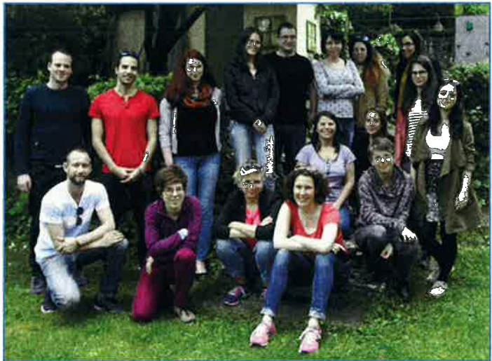
Haver csapatépítő hétvége

A közösségépítés fontos összetevői a módszertan megújítási folyamatok, ebből idén összesen 6-féle volt, az egy délutánostól, a hónapokig tartóig. Ezekben a műhelyekben és folyamatokban átlagosan 3-5 önkéntes vesz részt. Nagyon fontosak ezek az alkalmak, az önkéntesek motivációjának fenntartásában, egymás megismerésében és az aktivitás növelésében is. Az utóbbi években kezd kialakulni egy 5-6 fős „keménymag”, akik több ilyen folyamatban is aktívan részt vesznek. Mindemellett hosszútávú cél növelni a tananyag fejlesztésben résztvevő önkéntesek számát.