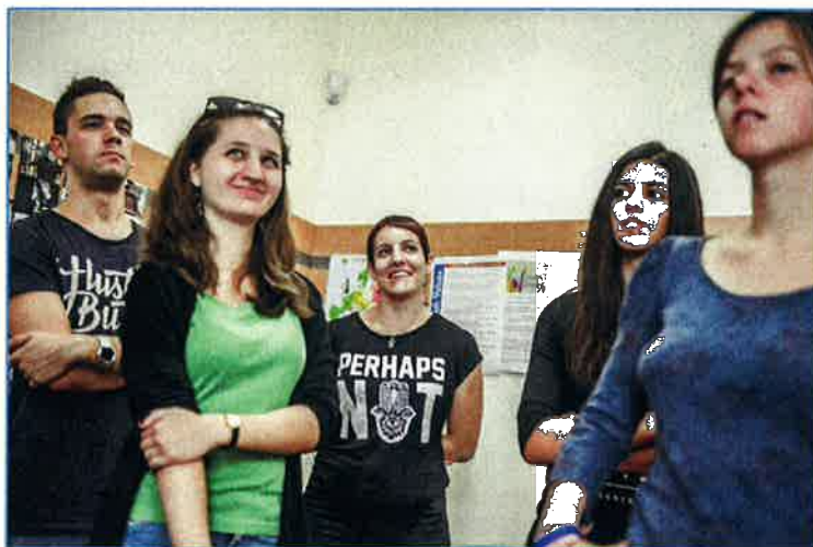
Haver-Uccu közös önkéntes képzés

Mivel a 2015 őszi önkéntes képzésünkön átlag feletti volt a létszám és utána a nagy részük elkezdett bekapcsolódni a munkába, nekik az év elején inkább tartunk továbbképzés, a professzionalizmus növelése és az elköteleződés erősítése érdekében. A 2016 tavaszi önkéntes képzés résztvevői közül 7 aktív taggal bővült a Haver csapat.