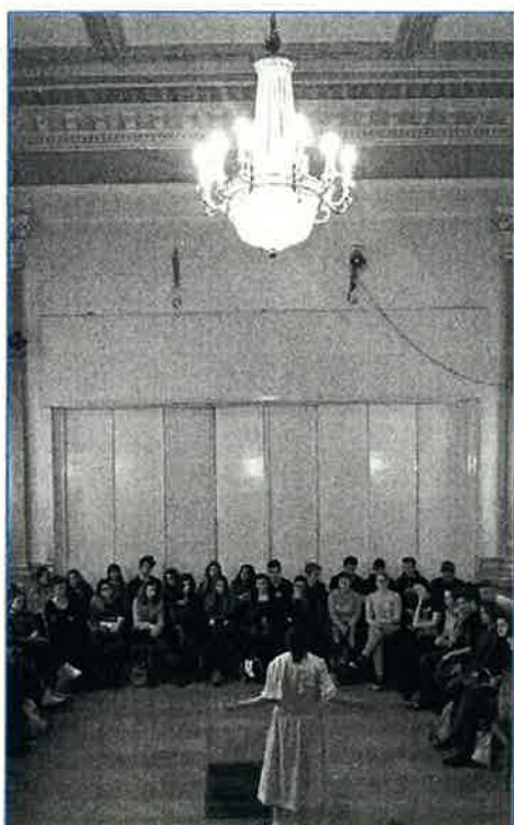
Szakácskönyv a túlélését - tantermi előadás

Az UCCU Roma Informális Oktatási Alapítvánnyal folyamatos együttműködésben dolgozunk. Jelenleg is fut egy közös projektünk is, amelynek keretében pedagógusoknak tartunk közösen érzékenyítő foglalkozásokat. Ebben a foglalkozásban egy roma és egy zsidó fiatal kezdeményez párbeszédet tanári karokkal. A foglalkozás módszertani kidolgozását szakértők, önkéntesek és gyakorló pedagógusok részvételével egy kétnapos műhely során kezdtük el, majd a Haver és Uccu csapata véglegesítette. Ez a projekt 2017 májusig tart, de tervezzük, hogy tovább fejlesztjük a foglalkozást. Lezárult a Gólem Színházzal közös projektünk, melynek keretében a Szakácskönyv a túlélésért című darab tantermi változatához készítettünk egy 45 perces foglalkozást. Idén a Gólem Színházzal ezer budapesti és vidéki diákot értünk el.