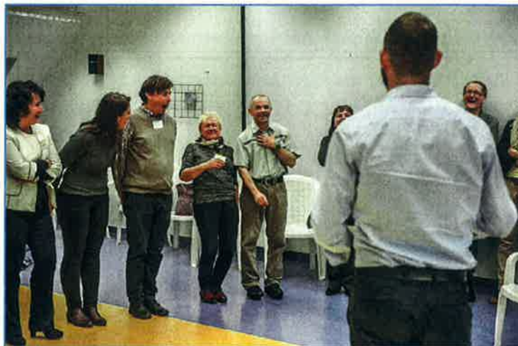
Közös Nevező Tanárszeminárium

A Mozaik Hub stábjával közös munka eredményeképp az év végére befejeződött a stratégiai tervezés folyamata is.